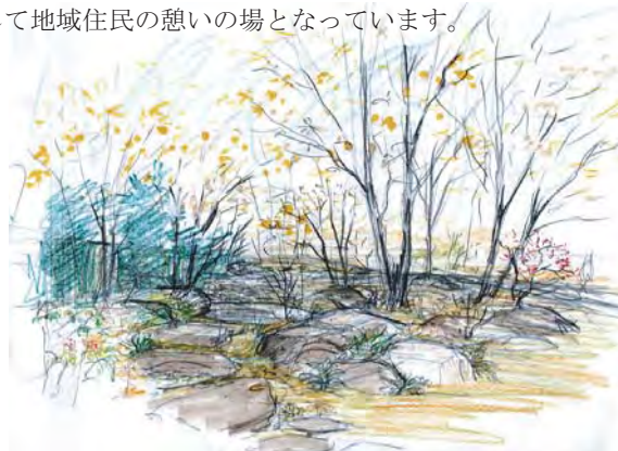
中の庭：保存木のケヤキで迂回する園路

アルビス緑丘の自然散策路は上の庭・中の庭・下の庭を経由します。各庭は建替え前の特徴を活かした休憩場所になっています。四季折々に変化する団地内外の景色を回遊できる散歩コースとして地域住民の憩いの場となっています。