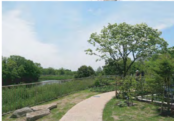
上の庭：ヒトツバタゴの背景に舟池と水月公園を俯瞰する雄大な景色