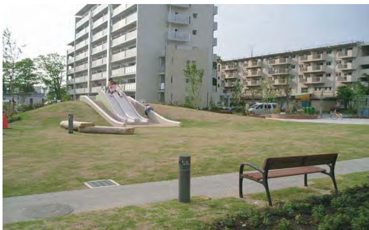
築山のあるひろば

築山は周辺の遊び場、花壇、玄関などの異なる生活領域を、互いの気配を感じながらやわらかく区分する。