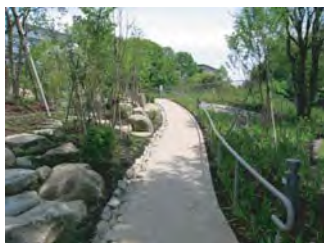
視界が刻々と変化する散策路