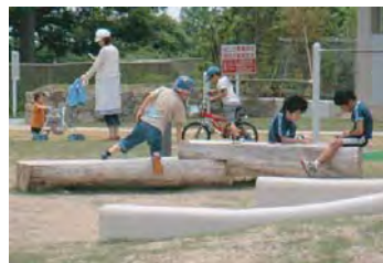
保存できなかった樹木はベンチにリサイクル加工

樹高6m 幹周1.3m 枝張6m 切り土地盤であったため根は浅く地表面を這い、花壇や配管周りの通気性と腐植に富んだ方向へ太い根が伸びていた。掘り取りは太根をたぐりがらの追い掘り。根鉢は直径4m、高1mの皿型